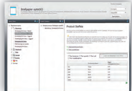
Alle productinformatie kunt u in het systeem kwijt.