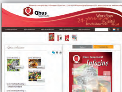
Integratie met Docuboxx Generator.