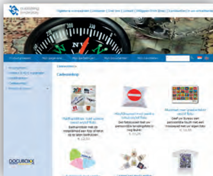
Een standaard interface voor gebruikers die nog niet ingelogd zijn.