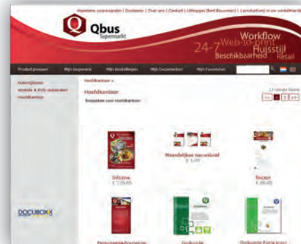
Iedere geregisteerde gebruiker kunt u zelf eenvoudig voorzien van zijn eigen look-and-feel en assortiment.