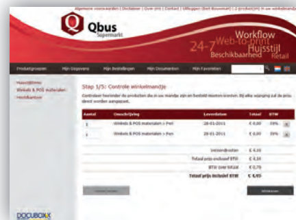
Winkelmandje met diverse afrekenmethodes.